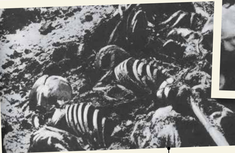
Крематорий Останки людей, сожжённые в печах крематория лагеря Майданек. Фото сделано в июле 1944 года.

Превращение в пепел Большинство евреев в лагерях смерти умерщвлялись в газовых камерах. Людей туда массово направляли под предлогом «санитарной обработки». Затем трупы сжигали в специальных печах. За день в таких огромных концлагерях, как Освенцим, превращали в пепел до двух десятков тысяч человек. На фотографии заключённые, работавшие в крематории лагеря Майданек, демонстрируют процесс сжигания трупа. Снимок сделан после освобождения лагеря.