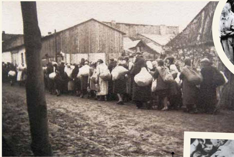
Обречённые Группа евреев, доставленная в лагерь смерти Майданек из гетто в польском городе Енджеюве. Фото сделано в сентябре 1942 года.