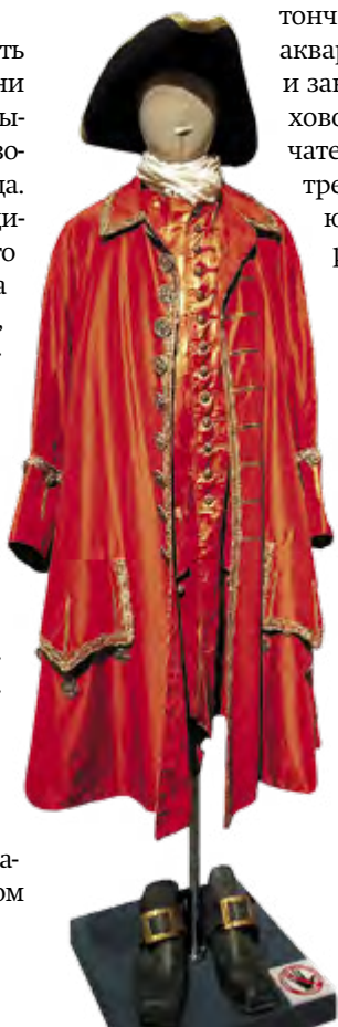
Костюм сибирского губернатора Матвея Гагарина, изготовленный для фильма «Тобол»

У вышивки, которая поступи-ла в музей из собрания Омского