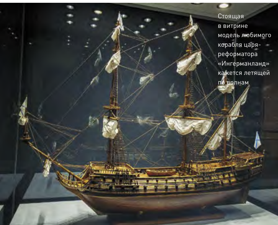
Стоящая в витрине модель любимого корабля царя-реформатора «Ингерманланд» кажется летящей по волнам