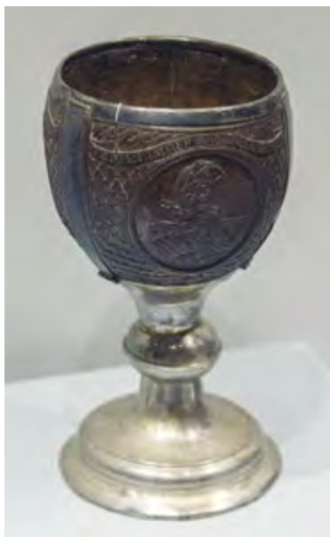
Кубок из кокосового ореха украшен портретами Петра I, Петра II и Анны Иоанновны