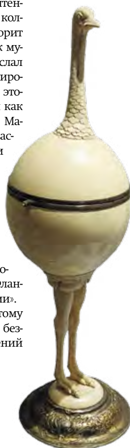
Германский сосуд-шутиха в форме страуса сделан из страусового яйца

Причем эскиз горельефа был сделан незадолго до того, как Петр принял решение организовать экспедицию за еркентским золотом. Этот факт отразили в инсталляции, размещенной под горельефом. В ней еркентское золото, которое так и не удалось добыть, совместили с исторической картой 1730-х годов, на которой показана Джунгария и прилегающие к ней земли. На карте обозначили и путь экспедиции Бухгольца. Отмечено