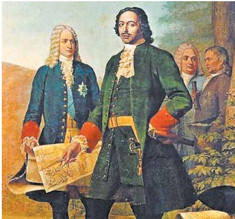
Меншиков и Петр I. Фрагмент картины А. Венецианова «Петр Великий. Основание Санкт-Петербурга»