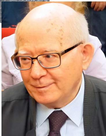
Борис Львович Фонкич (1938–2021)