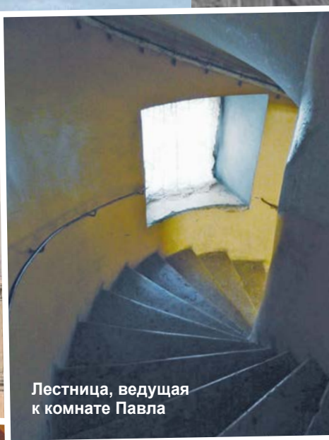
Лестница, ведущая к комнате Павла

Как написано у Ланжерона, император был безумен и вел страну к гибели, а совершить задуманное Пален мог, лишь заручившись поддержкой Александра. Он то льстил ему, то пугал относительно «его собственной будущно-