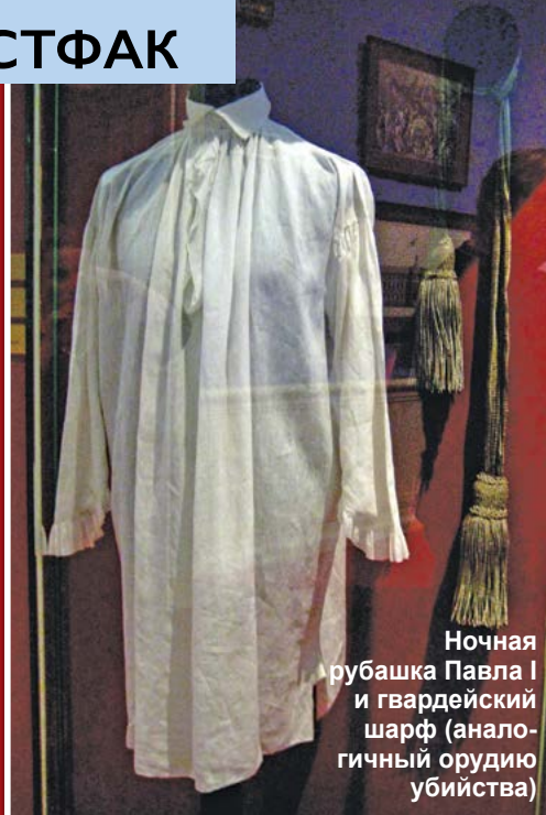
Ночная рубашка Павла I и гвардейский шарф (аналогичный орудии убийства)