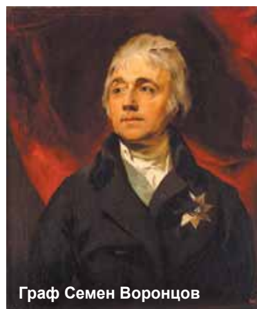
Граф Семен Воронцов

рбезно предложил Бонапарту дуэль в Гамбурге с целью положить этим поединком предел разорительным войнам, опустошавшим Европу».