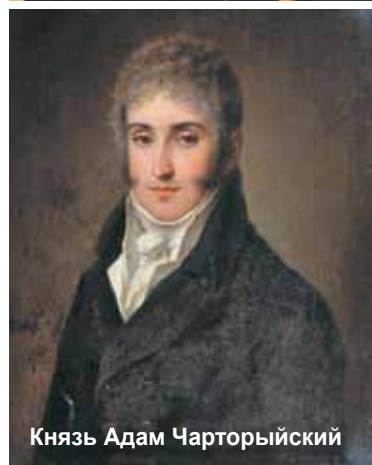
Князь Адам Чарторыйский