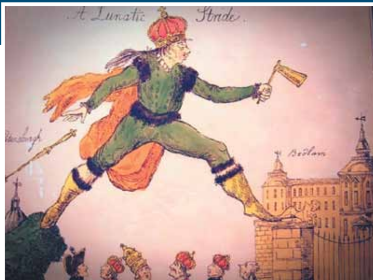
Карикатура на Павла I, опубликованная в Европе

Коцебу привел в своей книге дословно весь текст тех пометок, оригинал которых император разрешил ему оставить у себя: «Нас извещают из Петербурга, что русский император, видя, что европейские державы не могут согласиться между собой, и желая положить конец войне, уже одиннадцать лет терзающей Европу, намерен предложить место, в которое он пригласит всех прочих государей прибыть и сразиться между собой на поединке, имея при себе в качестве приспешников, судей поединка и герольдов самых просвещенных своих министров и искуснейших генералов, как то: господ